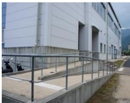
第2講義棟前スロープ