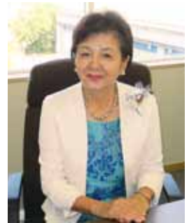
びわこ成蹊スポーツ大学学長 嘉田 由紀子

私は本学の学長に就任から3年目となりました。この2年間、卒業生が就職している学校や行政機関、民間会社などを訪問して先輩の評判を聞いて回りました。“びわスポ大”の卒業生は、「機転がきく」「体力・気力・胆力がある」